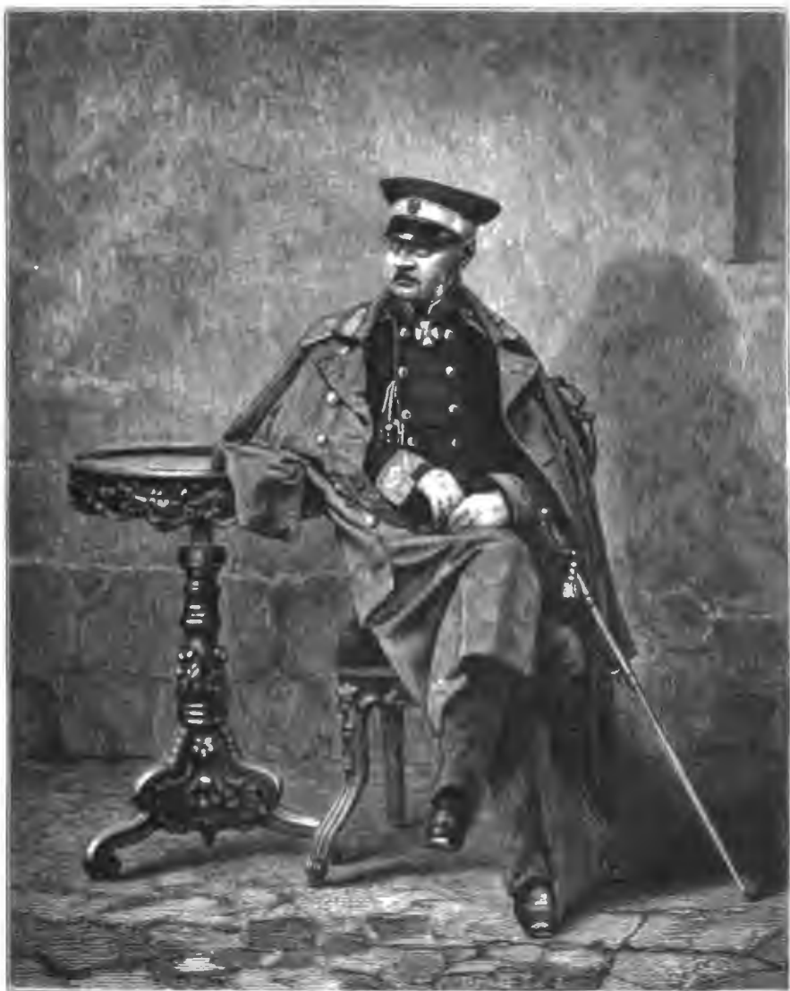
КНЯЗЬ МИХАИЛЬ ДМИТРИЕВИЧЪ ГОРЧАКОВЪ