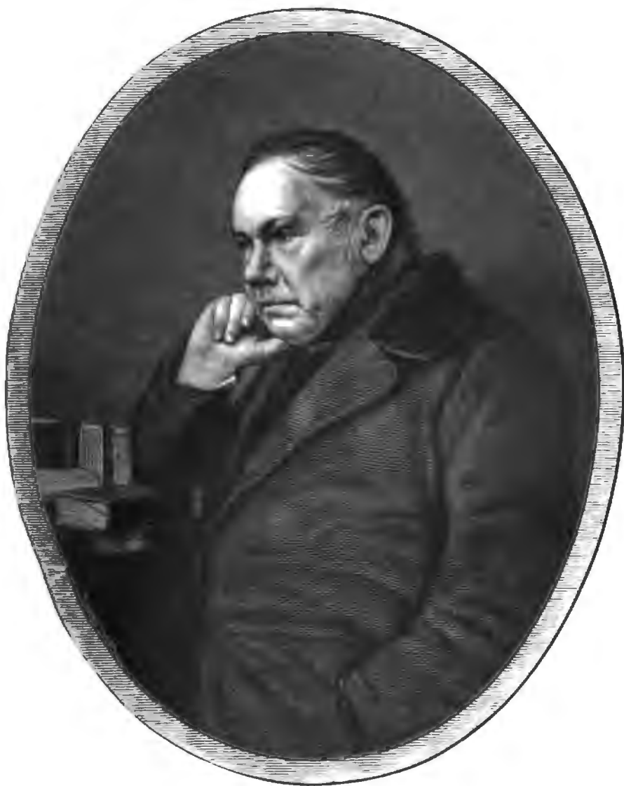
ВАСИЛІЙ АНДРЕЕВИЧЪ ЖУКОВСКІЙ.